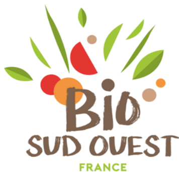
Logo Bannière BIO SUD OUEST FRANCE

La marque « BIO SUD OUEST FRANCE » se compose de deux logos :