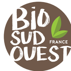
Logo Produit BIO SUD OUEST FRANCE

Cette marque est la propriété exclusive du Conseil Régional de Nouvelle-Aquitaine. La licence d'utilisation est déléguée à INTERBIO Nouvelle-Aquitaine. La gestion de la marque BIO SUD OUEST FRANCE est régie par le présent règlement. Toute imitation, contrefaçon, usage contraire au présent règlement de la marque BIO SUD OUEST FRANCE peut faire l'objet de poursuites judiciaires.